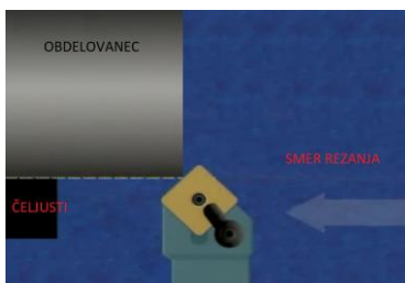
Slika 1 vzdolžni rez z istim nožem kot prečni – poravnava čela, žal ne pridemo čisto do čeljusti

Prvi, grobi rez lahko naredimo kar z pravokotno ploščico, vendar z njo ne pridemo čisto do čeljusti: